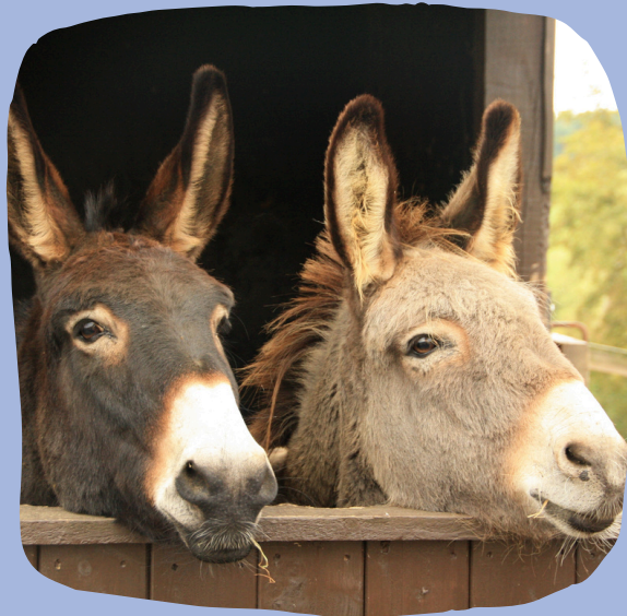
Staes & Ynke

Beter kan het niet worden! Wij hebben er al zin in :)